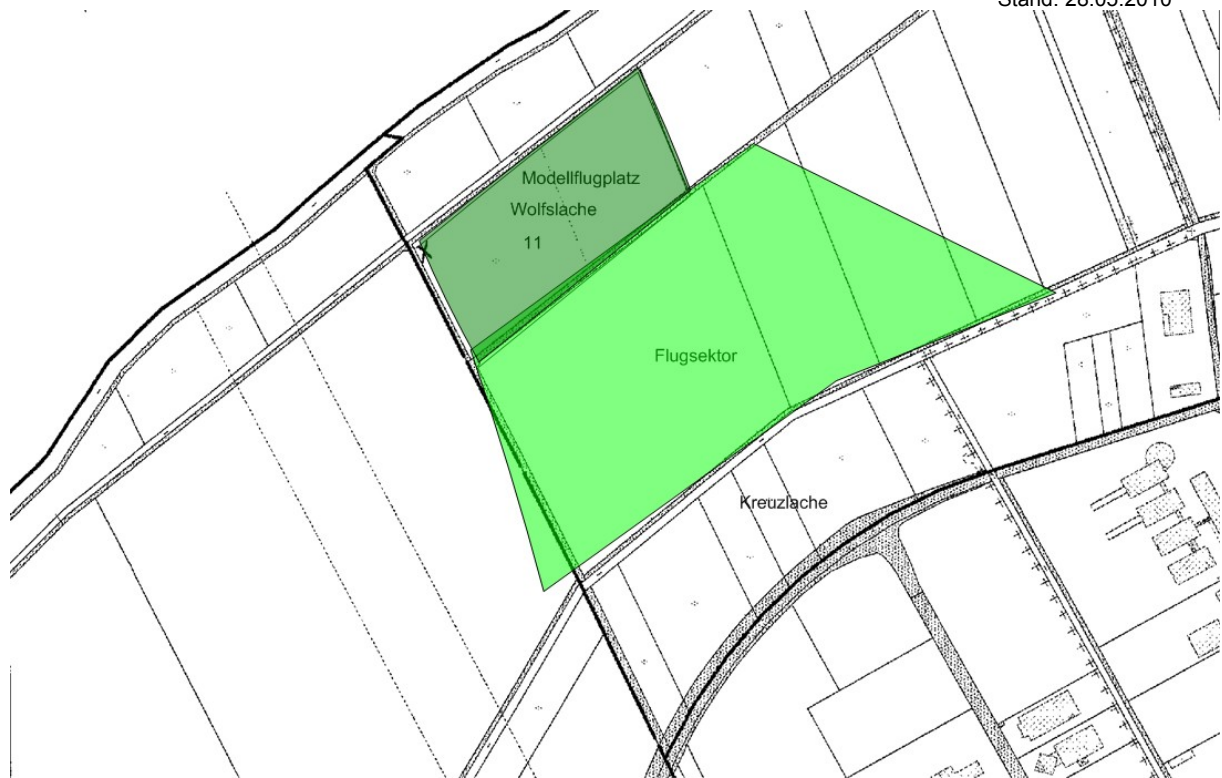
Skizze 2: Flugsektor

Diese Flugordnung dient zur Aufrechterhaltung der Sicherheit und der Erzielung geringst möglicher Umweltbeeinflussung durch den Modellflugbetrieb. Sie kann jedoch nicht alle möglichen Situationen berücksichtigen. Deshalb ist jeder Einzelne verpflichtet, durch sein Verhalten und seine Aufmerksamkeit zum sicheren, störungsfreien Ablauf des Flugbetriebs beizutragen!